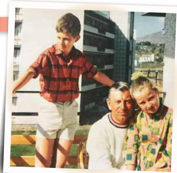
Met de familie op vakantie in Torremolinos.

Mijn vader werkte in de verzekeringen bij zijn broer, die een eigen assurantiëkantoor had. Thuis sprak hij geregeld over zijn werk; ik haalde hem ook weleens op van kantoor. Vanaf mijn twaalfde werkte ik in de