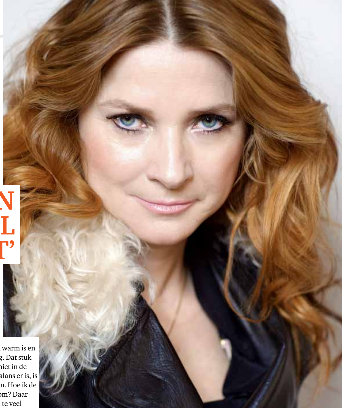
TEKST: INGRID SPELT. ILLUSTRATIES: PIET PARIS.

Een feministe, zo wil ze zichzelf niet noemen. Wel heeft die groepering voor Marlies de weg vrijgebaand, daar is ze van overtuigd. 'De tweede feministische golf was net geweest toen ik rond de 15 was. De bh werd verbrand en als het maar even kon, liepen vrouwen topless. Ik vond dat te vrij. Het spel van verhullen en onthullen vind ik te mooi om het als vrouw niet te mogen spelen. Mystiek vind ik belangrijk. De weggegeven erotiek wilde ik terugpakken. Ik ging op zoek naar de vrouwelijke versie van erotiek. Wat vinden wij mooi en spannend? Hoe willen wij onze schoonheid laten zien? Wat hebben vrouwen voor mij gepresteerd? Welke vrijheden zijn