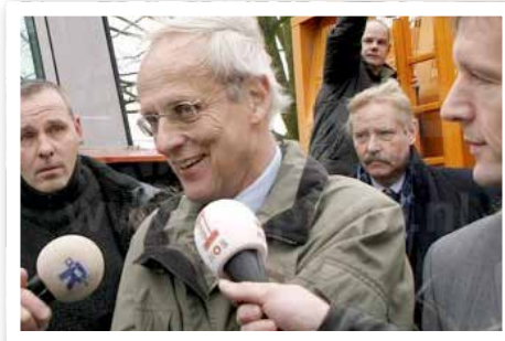
Winsemius als minister tijdens een actie van boeren tegen het landbouwbeleid (2007).

Ik heb dan ook pakken diploma's, haha. Door mijn opvoeding ben ik niet omkoopbaar en staat veel geld verdienen niet bovenaan mijn lijstje. In mijn leven heb ik mooie aanbiedingen met hoge salarissen gekregen, maar ik koos voor andere uitdagin-