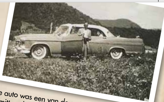
'Die auto was een van de weinige luxes die hij zich permitteerde.'